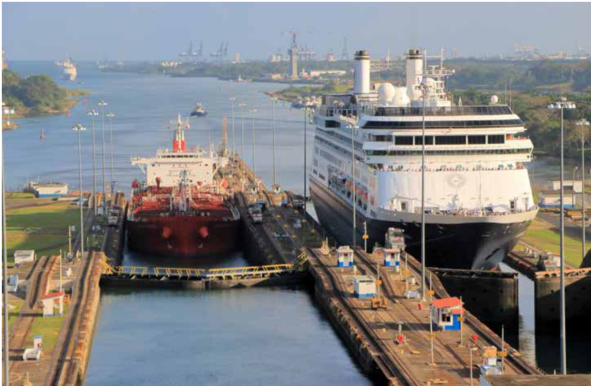
Canal de Panamá