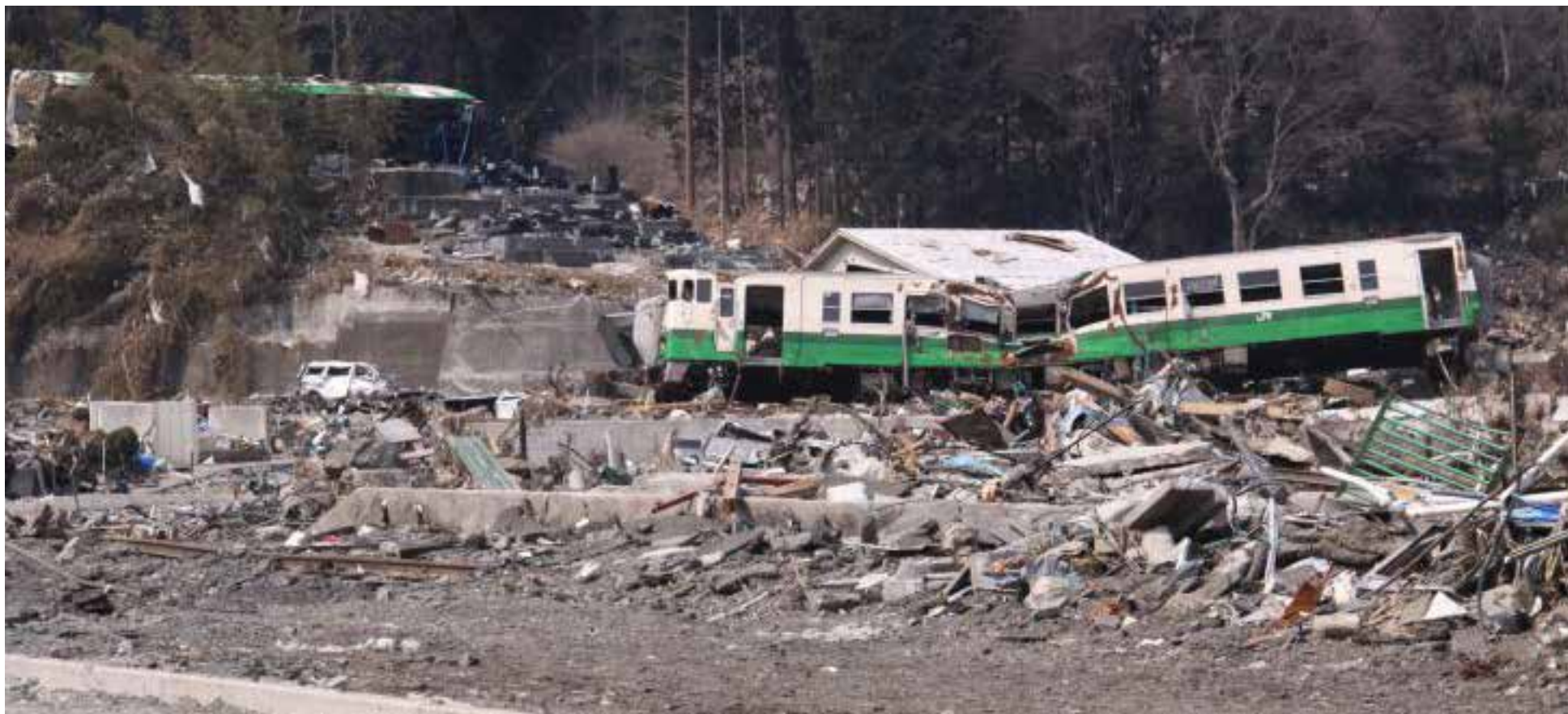
Tren arrastrado por el tsunami de la estación de ONAGAWA

La tierra en el noreste de Japón rugió y se sacudió, desatando un tsunami monstruoso que engulló pueblos y vidas con aterradora velocidad. Entre los incontables desplazados se encontraba Hiroko, una mujer de mediana edad que perdió a su esposo y su hogar ante las implacables olas. A la deriva en un refugio temporal, el dolor era su constante compañero, el silencio solo interrumpido por los sollozos de otros que compartían su inimaginable pérdida.