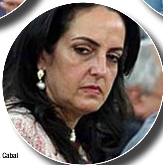
María Fernanda Cabal