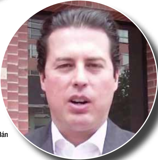
Juan Manuel Galán

El reloj electoral para 2026 ya resuena en los pasillos del poder colombiano, y el tablero político se agita con nombres que buscan tallar su destino en la historia. La fragmentación, esa bestia de mil cabezas que ha marcado la política reciente, se erige como el primer gran obstáculo,