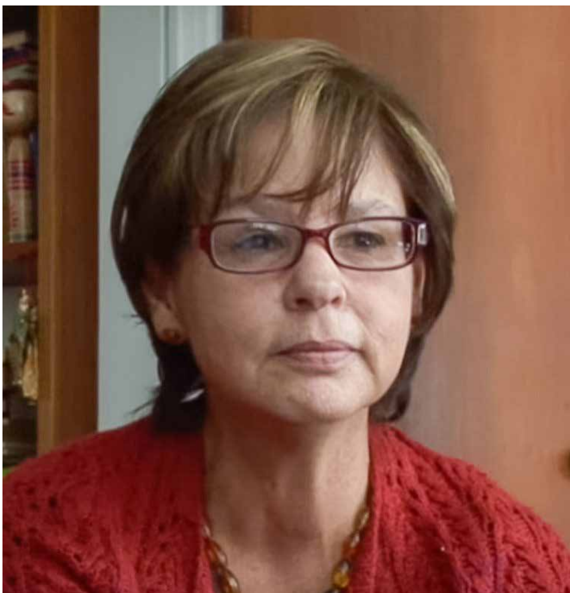
Escritora Piedad Bonnett

Sin embargo, la escritora alertó sobre la mercantilización y la manipulación del cuerpo en la era de las pantallas, citando al filósofo Pascal Bruckner y su visión de una «humanidad de clones» producto de la cirugía estética y la congelación de óvulos en jóvenes. Esta fiebre por la imagen idealizada, aunque a veces monstruosa, encierra también una «enorme revolución»