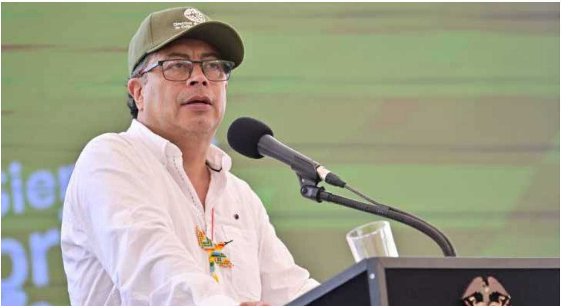
Gustavo Petro, presidente de Colombia.

E l presidente Gustavo Petro insistió al Senado de la República a no «darle la espalda al pueblo» y a respaldar su propuesta de Consulta Popular para la Reforma Laboral. Desde Soledad, Atlántico, donde instaló los Comités Ciudadanos de la Consulta, Petro convocó a una masiva movilización para el próximo 1 de mayo, Día del Trabajo, presentando el cuestionario de la consulta al Congreso. «Que el pueblo decida. ¿A qué le tienen miedo,