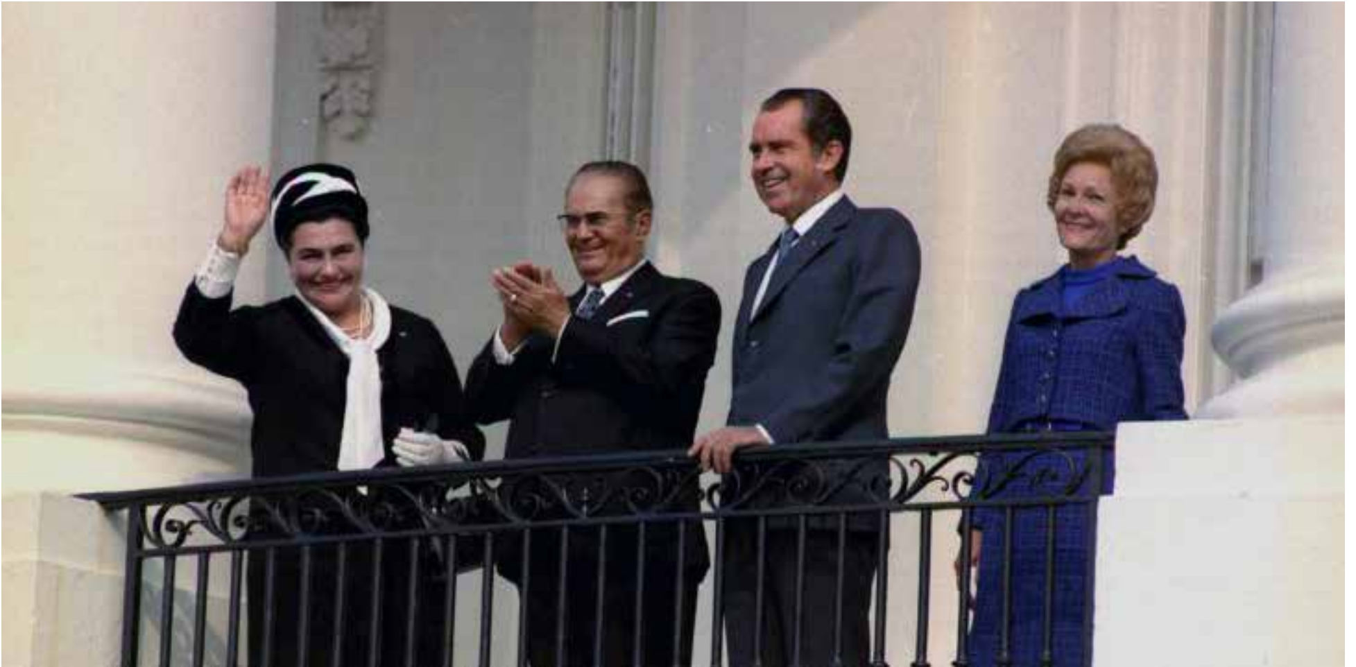
De izquierda a derecha: Jovanka Broz, Tito, Richard Nixon y Pat Nixon en la Casa Blanca (1971).

dó a Austria, la pequeña nación del centro de Europa.