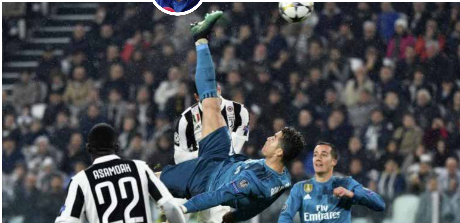
El gol de Cristiano Ronaldo se considera su gol de «chalaca» como el mejor de todos los tiempos.

L o mejor del fútbol, la habladera. Siempre lo he dicho. Lo mejor del gol, gritarlo, conversarlo, analizarlo.