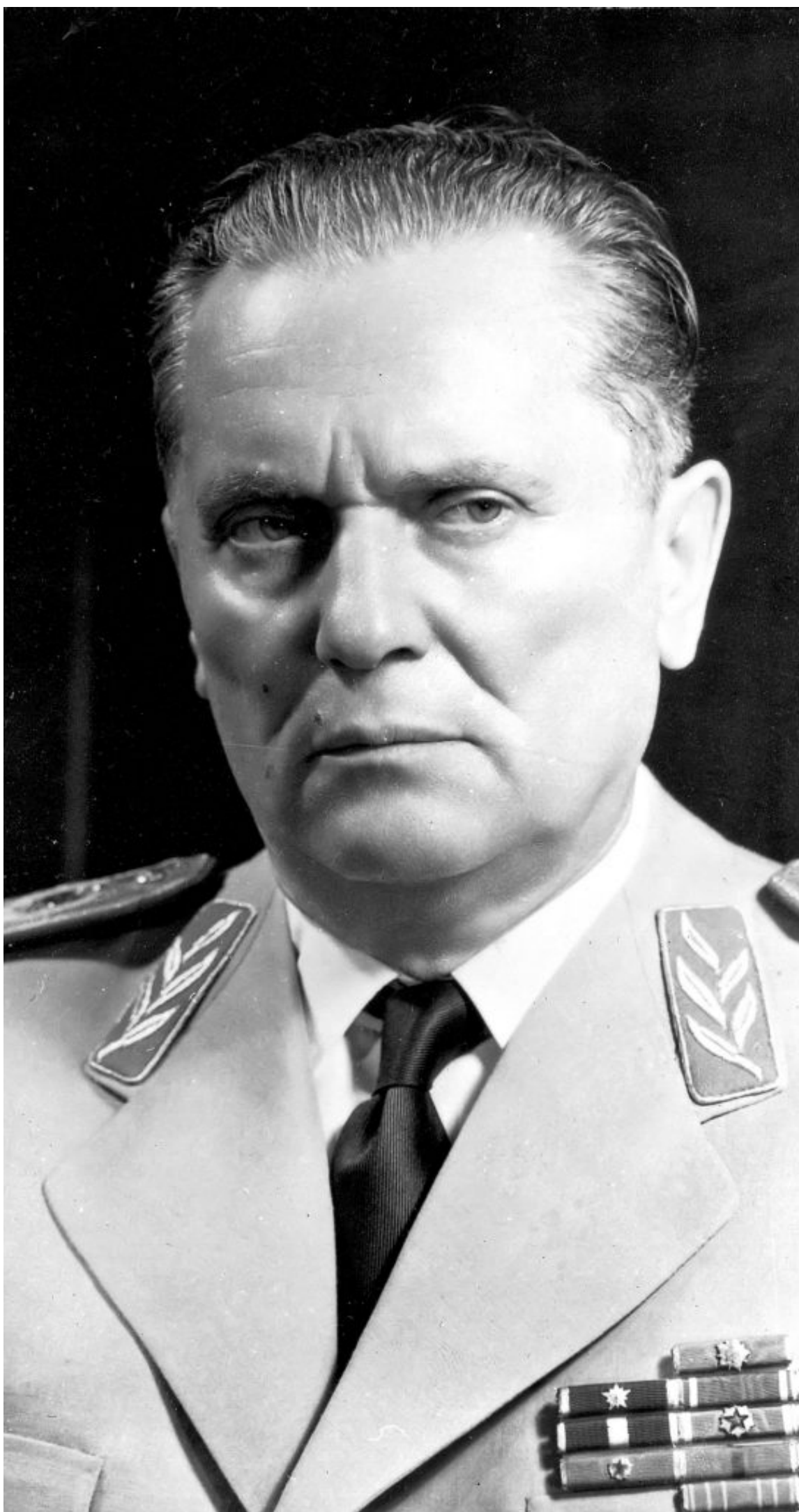
Josip Broz Tito

Cuando era un infante, sus padres lo dejaron en compañía de sus abuelos maternos, en Podsreda, quienes vivían en el campo en una casa cómoda, junto al ruido y el caudal de un río. Los abuelos le enseñaron el bosque de las inmediaciones. Tito aprendió a reconocerlo. Recorriendo a diario, descubrió que servía para esconderse, para escabullirse en medio de un pleito, para desaparecer de un enemigo que estaba por caerle encima, experiencia que en las guerras le sería útil.