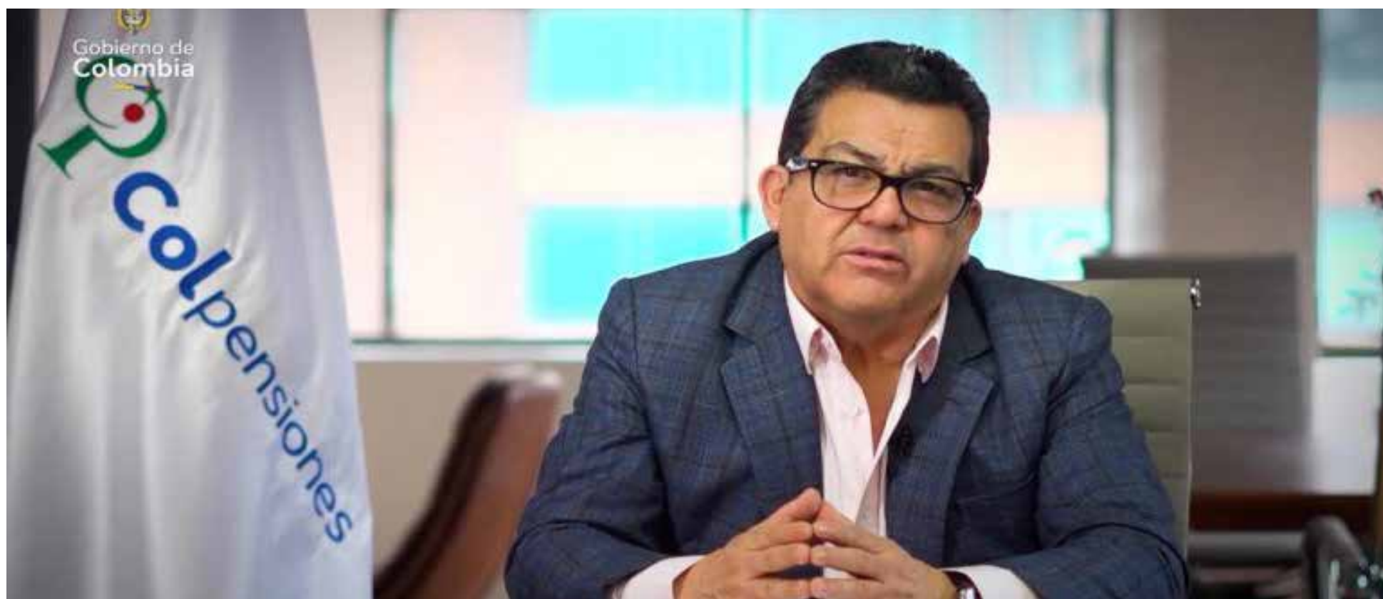
Jaime Dussán Calderón

E n un momento crucial para el sistema pensional colombiano, el presidente de Colpensiones, Jaime Dussán Calderón, ha reafirmado la «total preparación» de la administradora estatal para la implementación de la histórica Ley 2381 de 2024, que establece la Reforma Pensional a partir del 1 de julio de 2025.