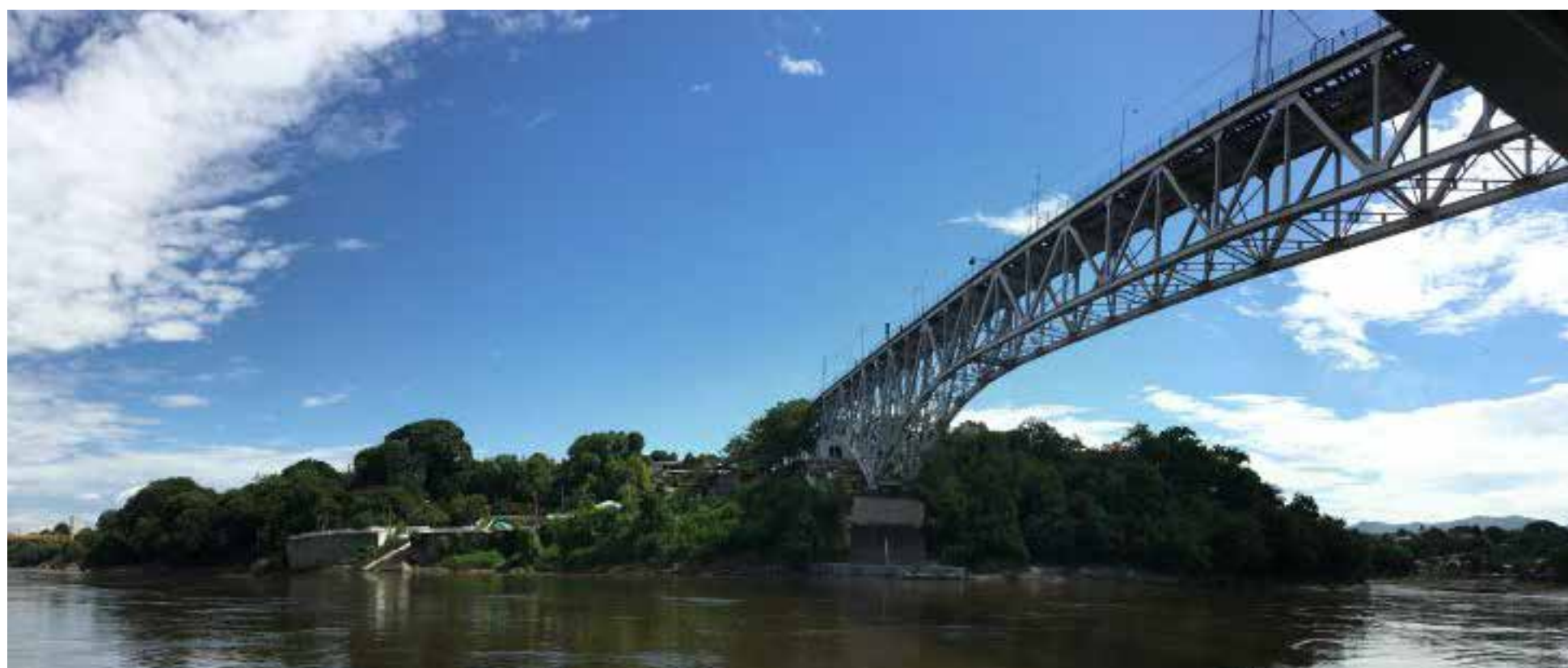
Tolima es atravesado de sur a norte por el río Magdalena.