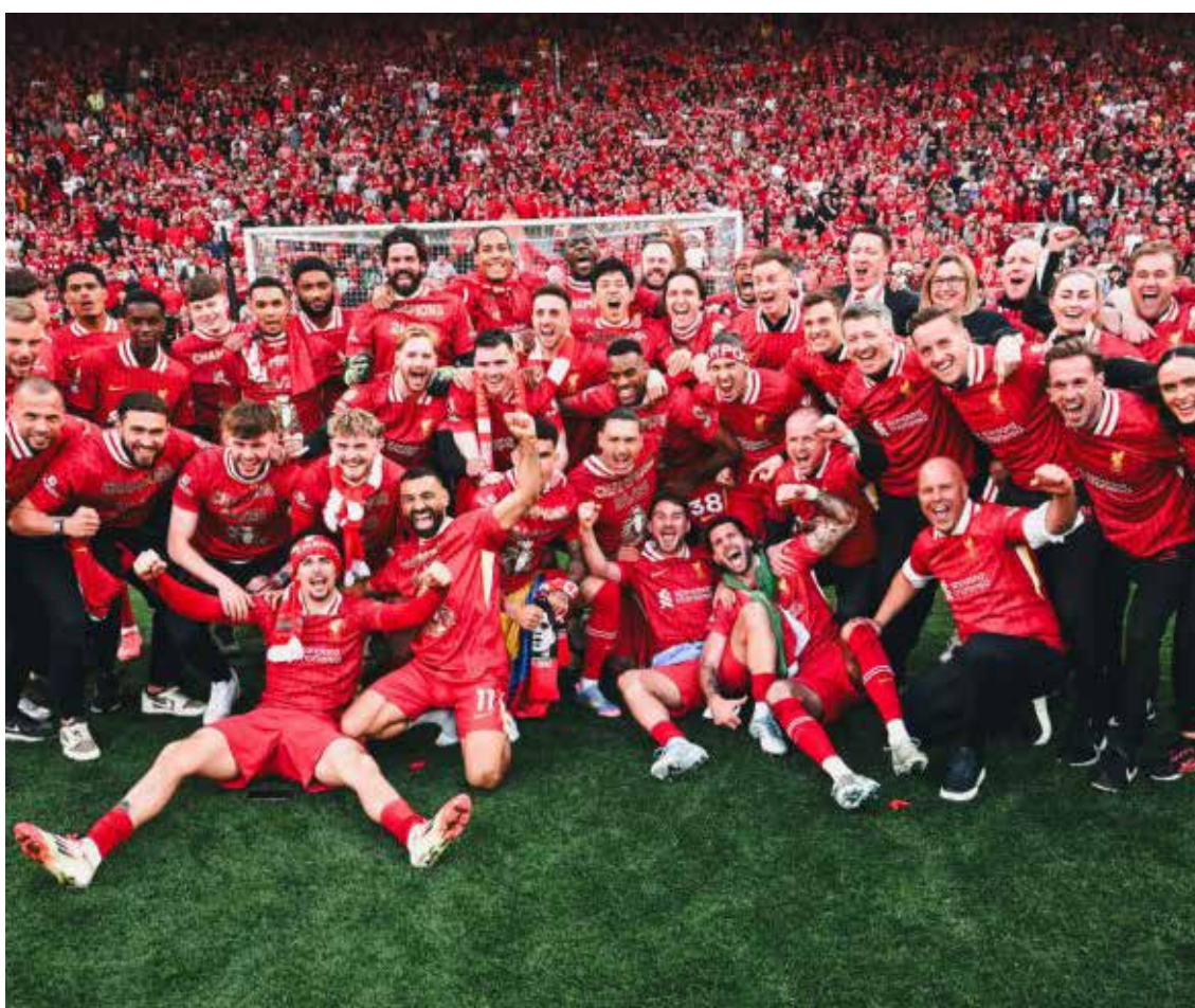
Todo el equipo celebrando.

equipo fue tal que se le considera un jugador clave en la obtención de este título de la Premier League.