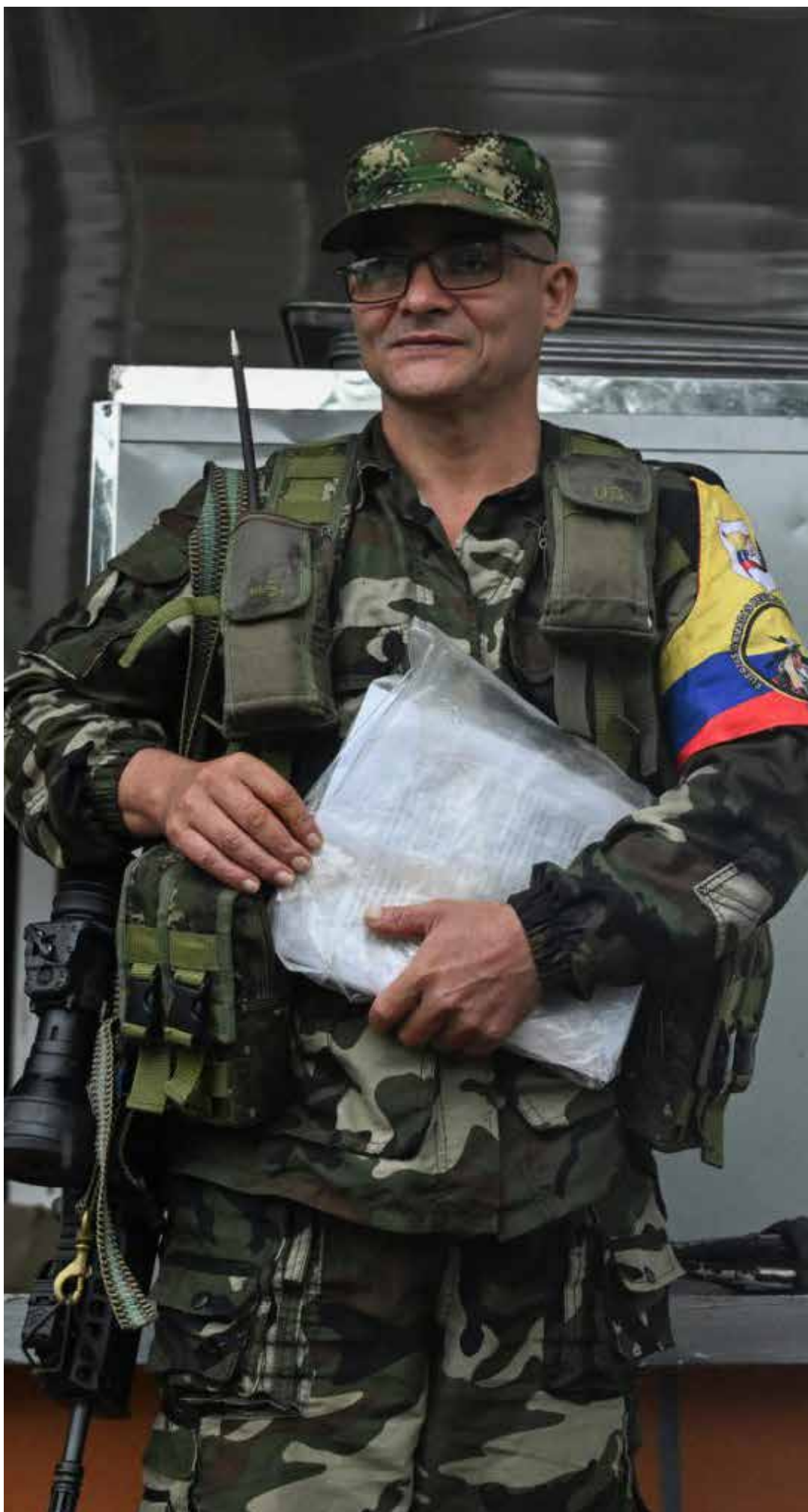
Néstor Gregorio Vera Fernández alias «Iván Mordisco»

Pese a los intensos operativos desplegados en la región, el líder del EMC ha logrado evadir el cerco de las autoridades, manteniendo en vilo a la cúpula militar y al gobierno nacional. «Iván Mordisco», quien comanda un número significativo de combatientes, representa un objetivo de alto valor estratégico para el Estado colombiano, que busca des-